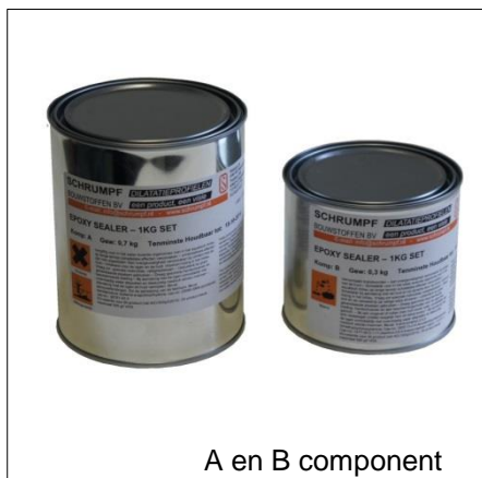
A en B component

2 Componenten epoxy-sealer t.b.v. ACME-, VA- en Neoferma profielen